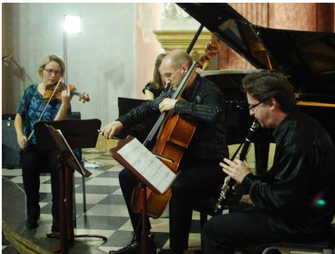
Závěrečný koncert festivalu MusicOlomouc.

čtvrtek 30. dubna 2015, 11:17 - Text: Eliška Vrbová