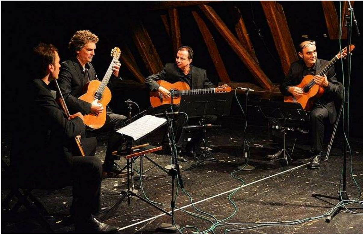
Aleph Gitarrenquartett

pod strunami. Tato úprava umožnila razantnější ohýbání tónu, ale zároveň témbrovou nápodobu zvuku nástroje koto při hře na kratší část struny. Artikulační rozsah nástroje však byl bezesbýtku využit již běžnými způsoby hry – perkusní údery, tremolo, pizzicato, přírazy... Vedle těchto technik byl rozšířen i pomocí drobných předmětů, např. kovovými náprstky či sponkou zavěšenou u kobyly, vytvářející výrazný efekt zkresleného tónu.