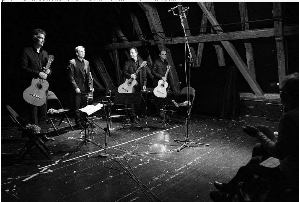
Aleph Gitarrenquartett

https://www.casopisharmonie.cz/kritiky/aleph-gitarrenquartett-v-olomouci-prehlicka-soucasneho-instrumentalniho-kvartetu.html